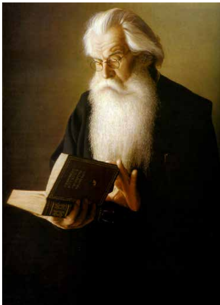
Портрет митрополита Волоколамского и Юрьевского Питирима (Нечаева, 1926–2003) художник Ю.А. Бирюков