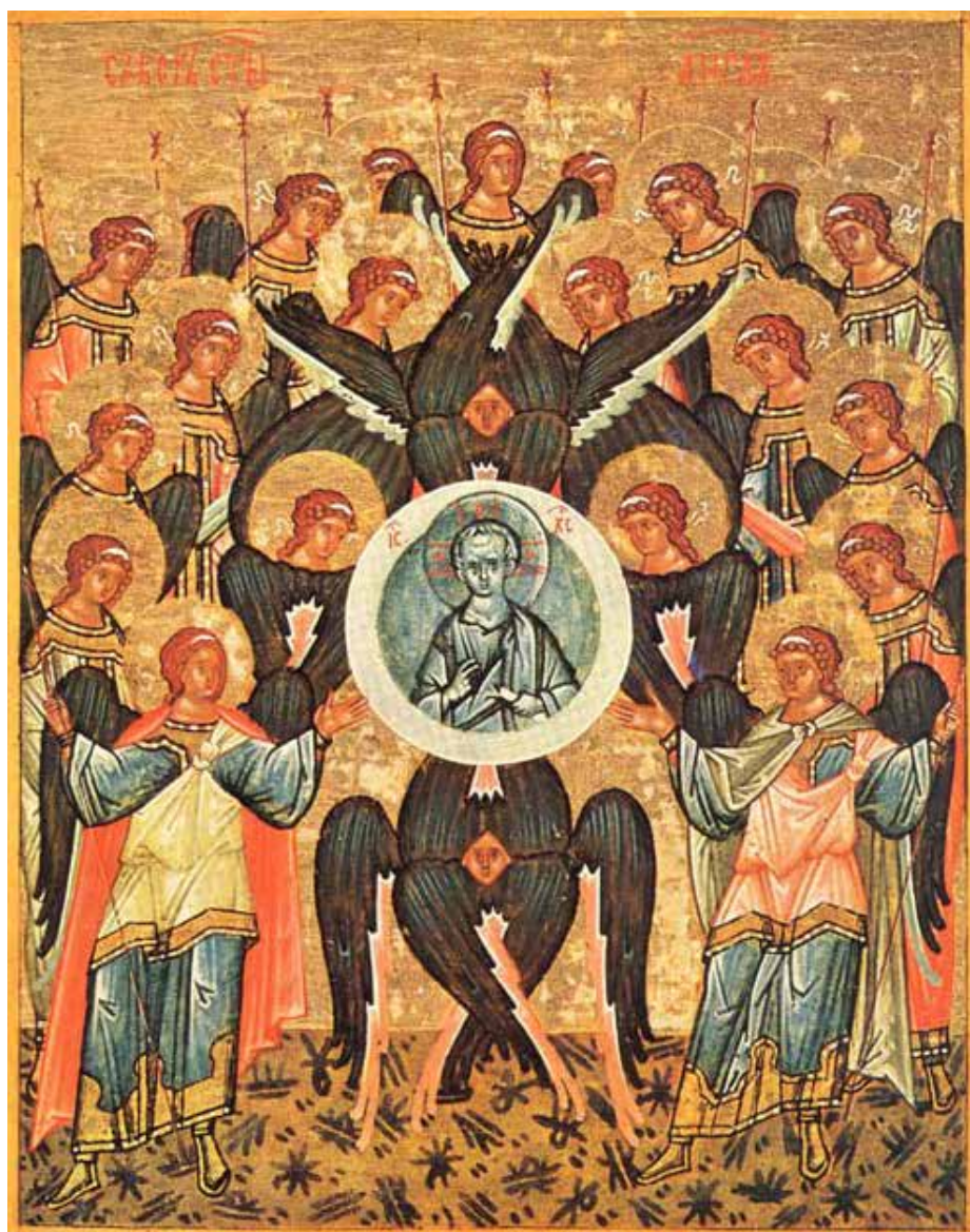
Икона Собора Архистратига Михаила и прочих Небесных Сил бесплотных конец XV в.