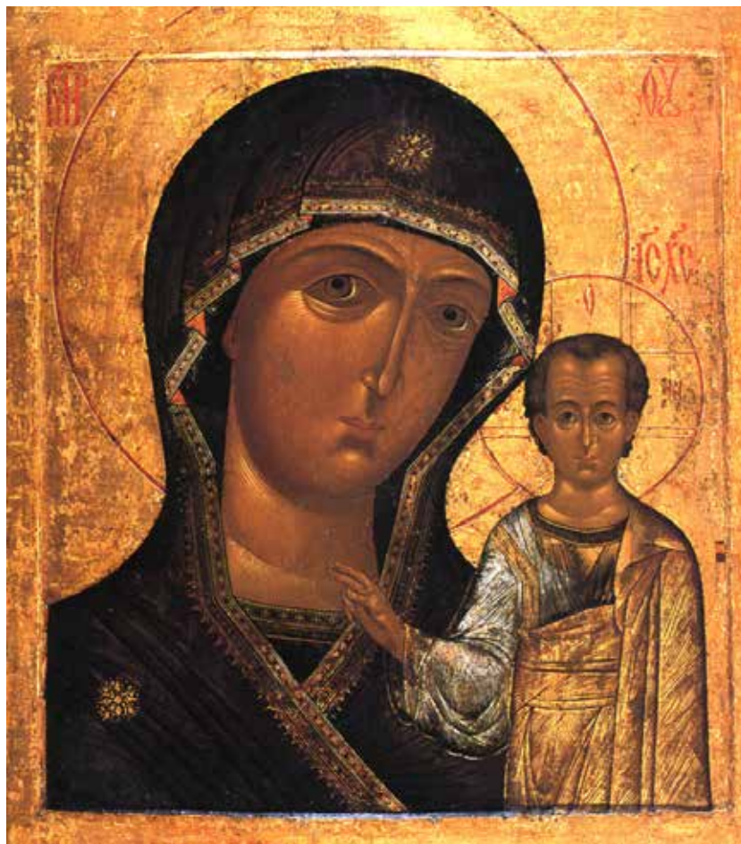
Казанская икона Божией Матери