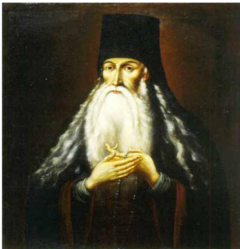
Портрет Преподобного Паисия Величковского