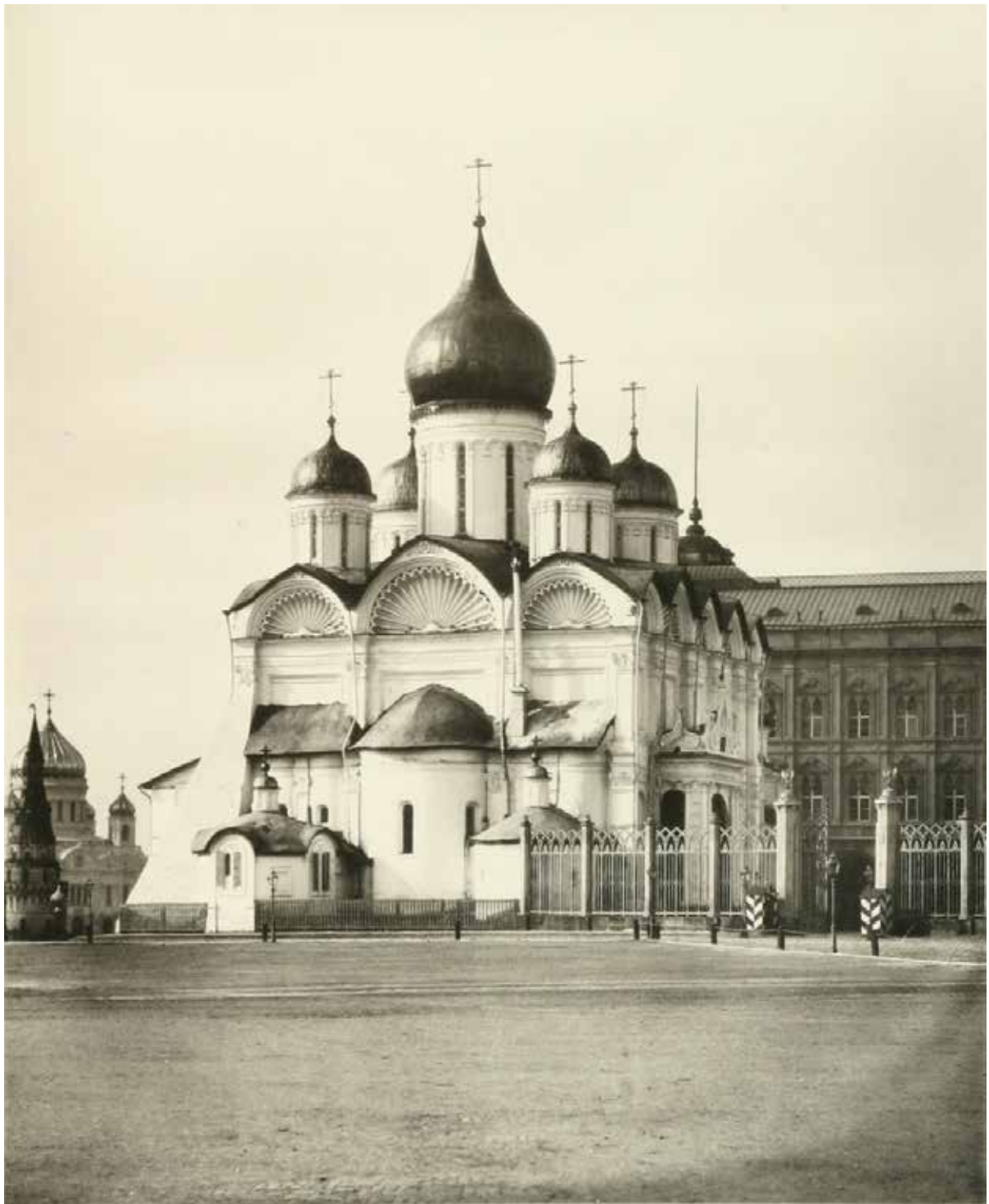
Архангельский собор Московского кремля Фото из альбома Н.А. Найденова, 1882 г.