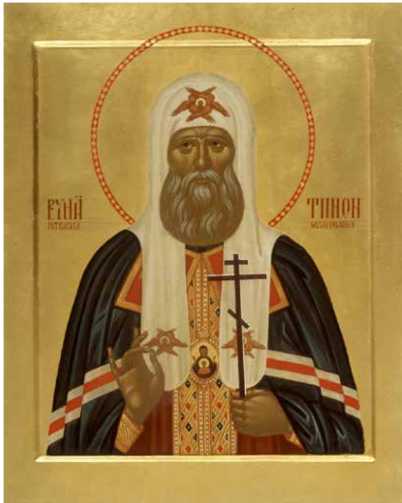
Икона святителя Тихона, Патриарха Московского и всея России,