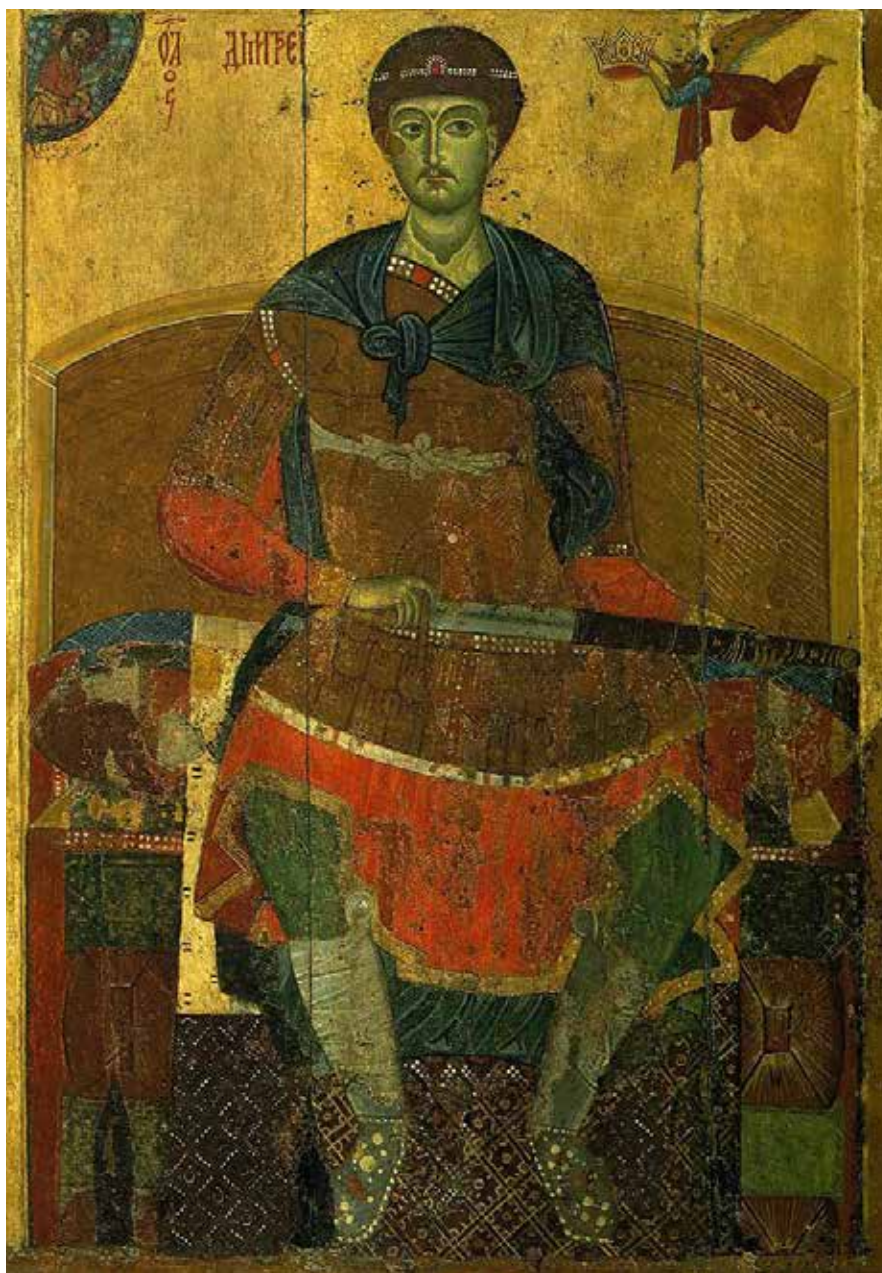
Икона великомученика Димитрия Солунского конец XII в. – начало XIII в. Государственная Третьяковская галерея

Воспоминание великого и страшного трясения (землетрясения), бывшего в Царьграде (740 г.)