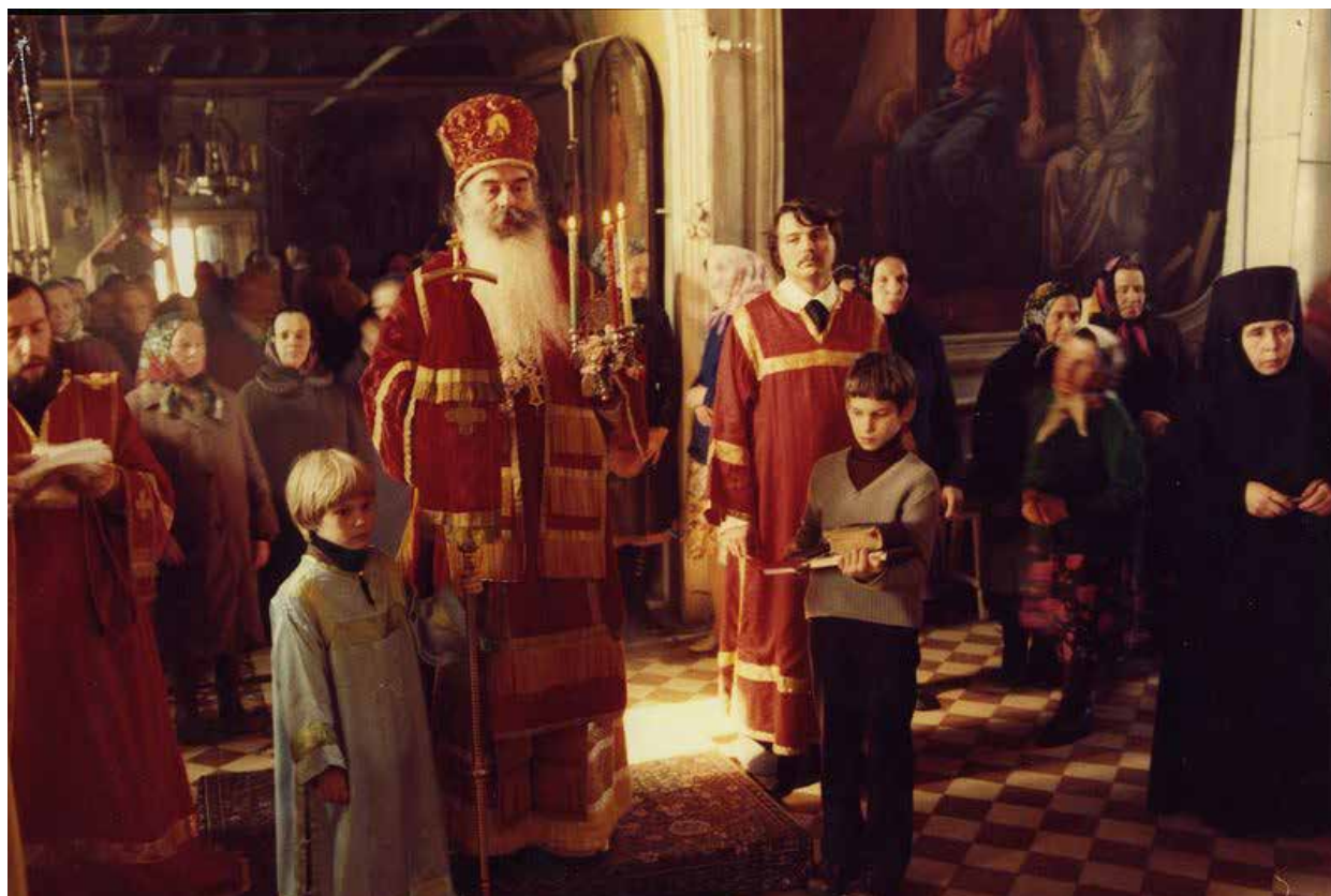
Пасхальное богослужение в Преображенском храме села Спас Волоколамского района

Митрополит Питирим (Нечаев) отошел ко Господу после тяжелой болезни в день Казанской иконы Божией Матери 4 ноября 2003 года и был погребен в Москве на Даниловом кладбище.